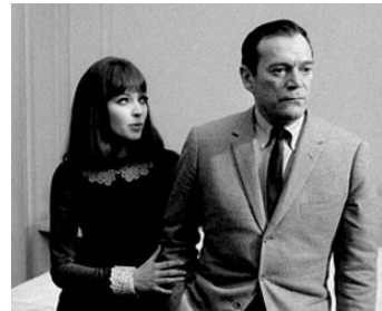
1964 ALPHAVILLE de Jean-Luc Godard avec Eddie Constantine