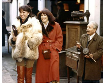
1978 CHAUSSETTE SURPRISE de Jean-François Davy avec Bernadette Lafont