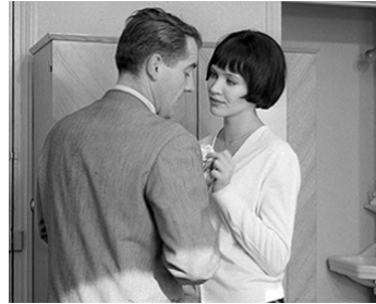
1962 VIVRE SA VIE de Jean-Luc Godard avec Dimitri Dineff