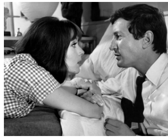
1960 CE SOIR OU JAMAIS de Michel Deville avec Claude Rich