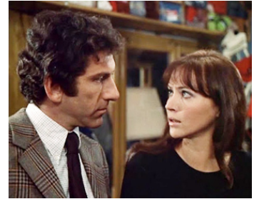
1971 NOTRE AGENT À SALZBURG (The Salzburg Connection) de Lee H. Katzin avec Barry Newman