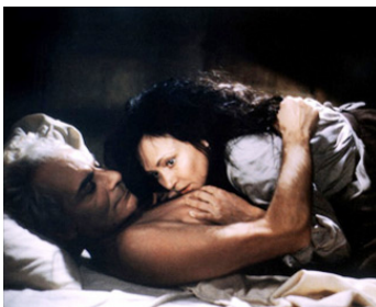
1988 L'ŒUVRE AU NOIR d'André Delvaux avec Gian-Maria Volonté