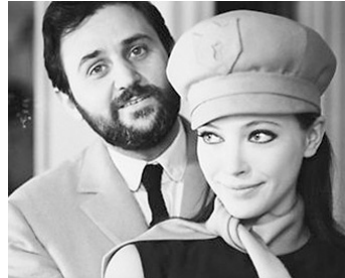
1963 UN MARI À PRIX FIXE de Claude de Givray avec Roger Hanin