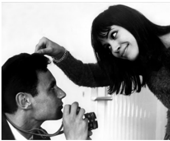
1960 LE PETIT SOLDAT de Jean-Luc Godard avec Michel Subor