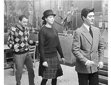
1964 BANDE À PART de Jean-Luc Godard avec Claude Brasseur, Sami Frey