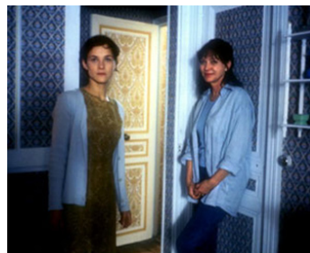
1994 HAUT BAS FRAGILE de Jacques Rivette avec Marianne Denicourt