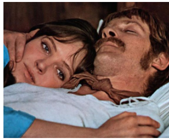
1968 MICHAEL KOHLAAS (Michael Kohlaas, der Rebell) de Volker Schlöndorff avec David Warner