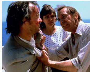
1985 L'ÎLE AU TRÉSOR (Treasure Island) de Raul Ruiz avec Lou Castel, Martin Landau