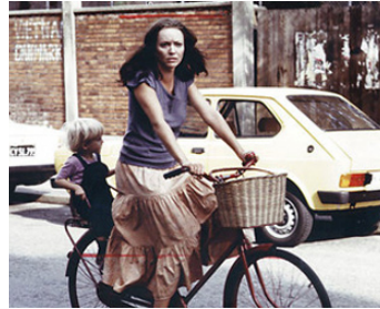
1978 L'HISTOIRE D'UNE MÈRE (Historien en em Moder) de Claus Weeke