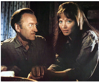
1968 AVANT QUE VIENNE L'HIVER (Before Winter comes) de Jack Lee-Thompson avec David Niven