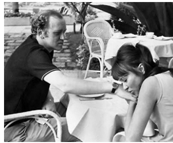
1969 CHAMBRE OBSCURE (Laughter in the Dark) de Tony Richardson avec Nicol Williamson