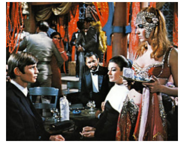
1969 JUSTINE (Justine) de George Cukor avec Michael York, Anouk Aimée