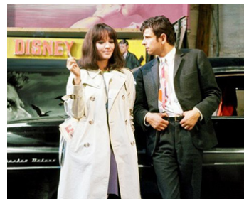
1966 MADE IN U.S.A. de Jean-Luc Godard avec Laszlo Szabo