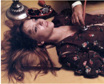
1969 LE TEMPS DE MOURIR d'André Farwagi