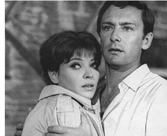
1964 LE VOLEUR DE TIBIDABO ( La Vida es magnífica ) de et avec Maurice Ronet