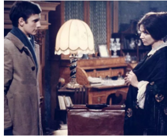
1971 RENDEZ-VOUS À BRAY d'André Delvaux avec Mathieu Carrière