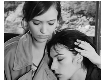
1965 DES FILLES POUR L'ARMÉE ( Le Soldatesse ) de Valerio Zurlini avec Marie Laforêt