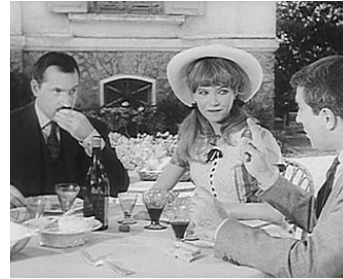
1962 LES QUATRE VÉRITÉS, Le corbeau et le renard d'H. Bromberger avec Michel Serrault, J. Poiret