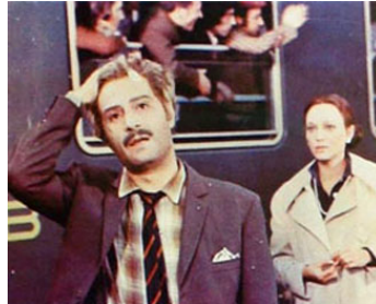
1973 PAIN ET CHOCOLAT (Pane e cioccolata) de Franco Brusati avec Nino Manfredi