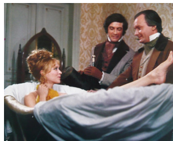
1967 LAMIEL de Jean Aurel avec Jean-Claude Brialy, Michel Bouquet