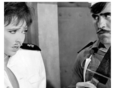
1966 TENDRES REQUINS ( Zärtliche Haie ) de Michel Deville avec Mario Adorf