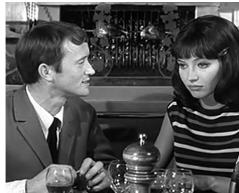
1964 DE L'AMOUR de Jean Aurel avec Philippe Avron