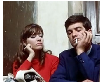
1961 UNE FEMME EST UNE FEMME de Jean-Luc Godard avec Jean-Claude Brialy