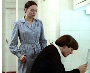
1975 L'ASSASSIN MUSICIEN de Benoît Jacquot avec Joël Bion