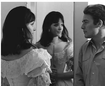
1966 LE PLUS VIEUX MÉTIER DU MONDE de Jean-Luc Godard avec Jacques Charrier