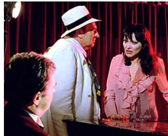
1986 DERNIER ÉTÉ À TANGER d'Alexandre Arcady avec Julien Guiomar