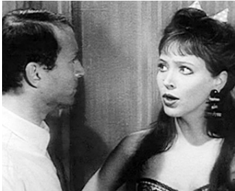
1963 DRAGÉES AU POIVRE de Jacques Baratier avec Claude Brasseur