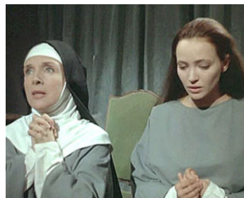
1965 LA RELIGIEUSE de Jacques Rivette avec Micheline Presle