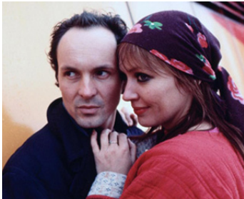
1976 ROULETTE CHINOISE (Chinesisches Roulette) de Rainer Werner Fassbinder avec Ulli Lommel