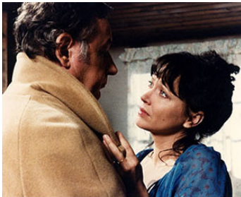
1983 L'AMI DE VINCENT de Pierre Granier-Deferre avec Philippe Noiret