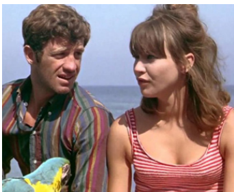
1965 PIERROT LE FOU de Jean-Luc Godard avec Jean-Paul Belmondo