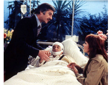
1975 LES ŒUFS BROUILLÉS de Joël Santoni avec Jean-Claude Brialy, Jean Carmet