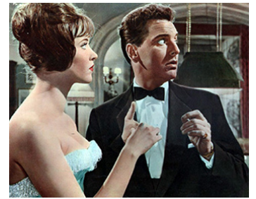
1961 SHE'LL HAVE TO GO de Robert Asher avec Bob Monkhouse